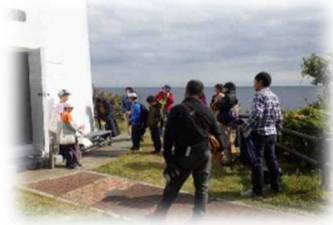
灯台の歴史に関する情報の収集活動