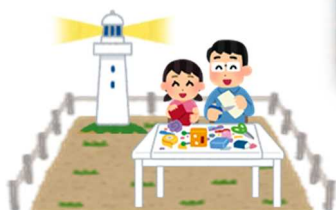
灯台敷地内でのワークショップの開催