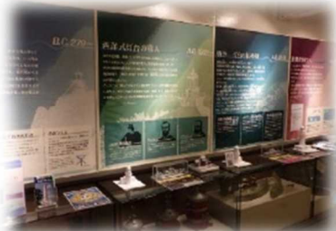
灯台の歴史等に関する資料館