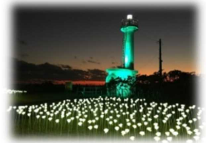
灯台及びその周辺のライトアップ