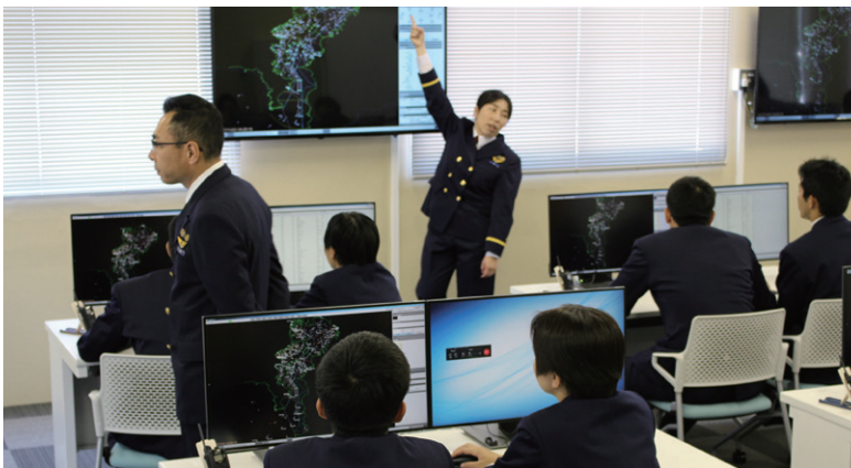
海上保安学校管制課程の授業風景