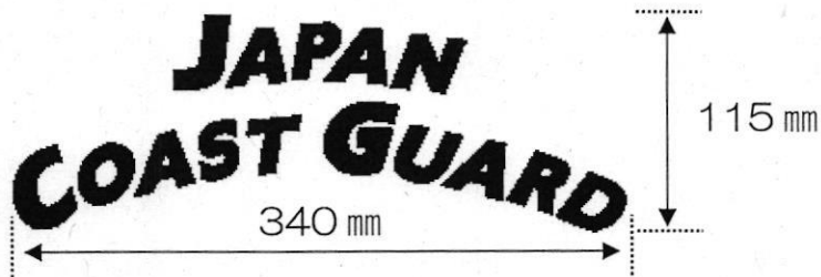
「JAPAN COAST GUARD」プリント (形状及び寸法 ※許容差±5mm)