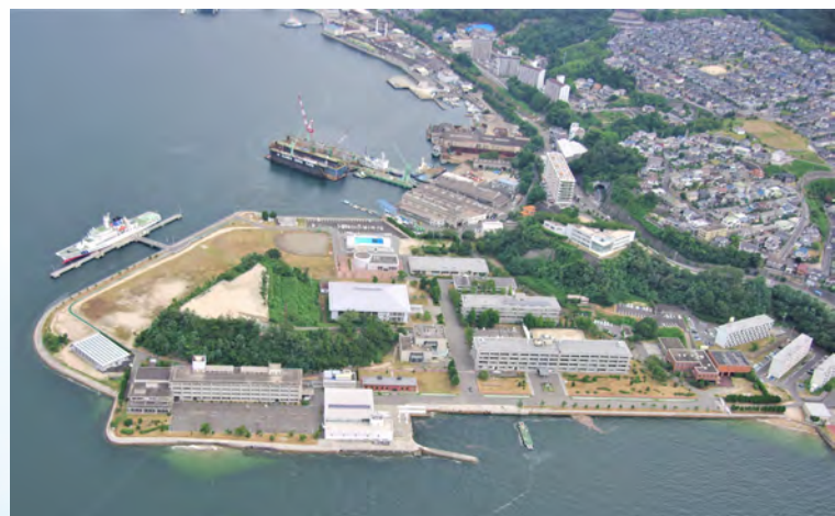
海上保安大学校（広島）