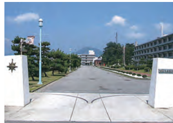
海上保安大学校 (広島)