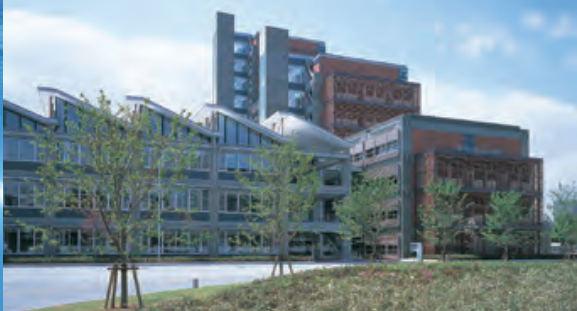
政策研究大学院大学（東京）