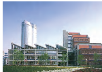
政策研究大学院大学 (東京)