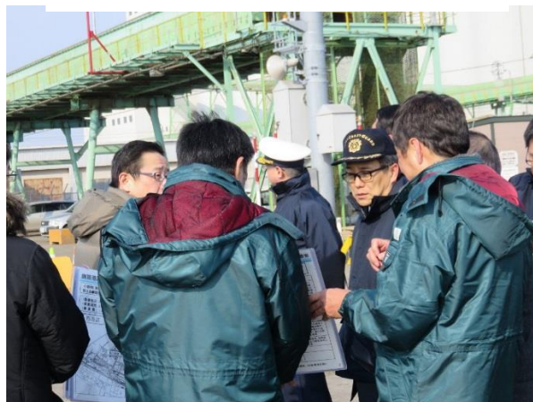
国際物流ターミナルの視察