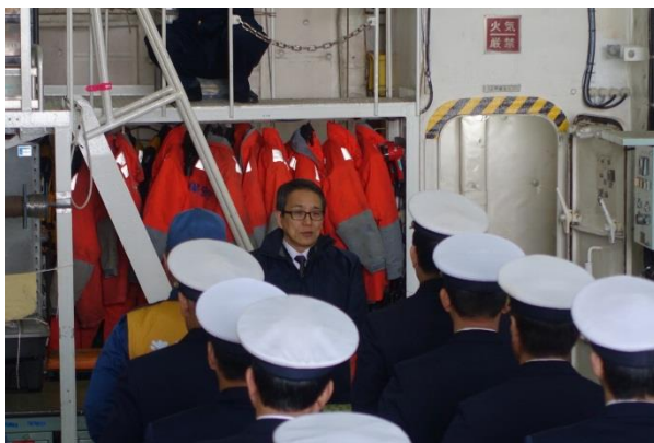
巡視船そうや乗員に対する激励