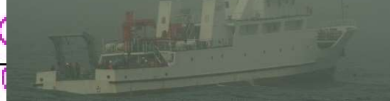
「HAE YANG2000」 2022.5.29,8.18