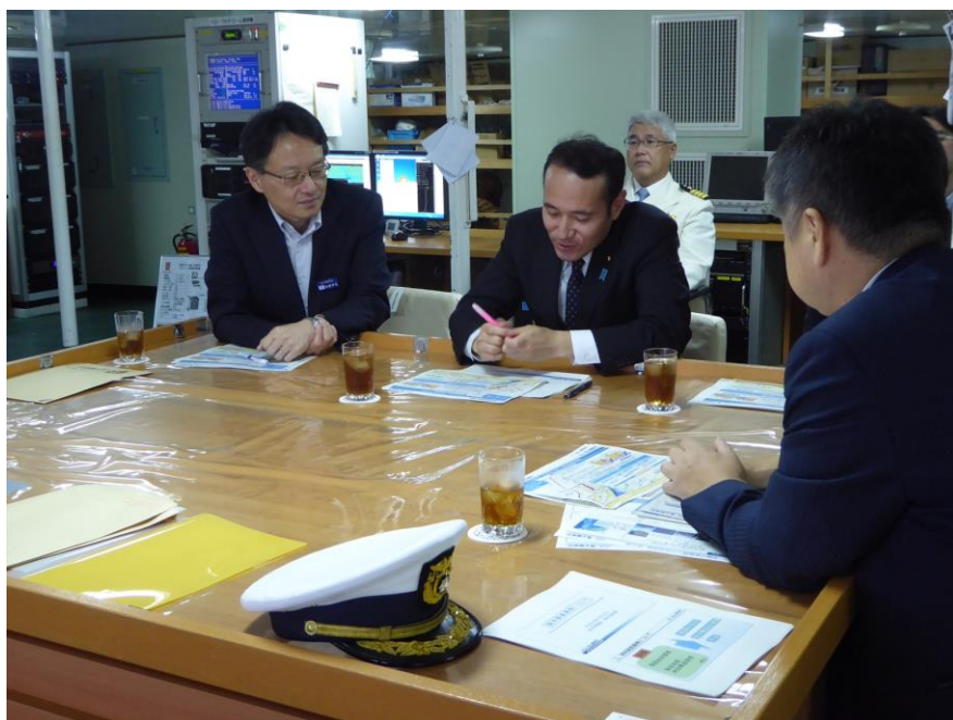
測量船拓洋にて業務概要説明を受けられる築政務官

築政務官は、測量船拓洋にて海洋情報業務説明等を受けられた後、船内を視察され、観測機器等の説明を受けられました。その後、青海合同庁舎に移動され、海洋情報資料館及び海洋汚染調査室を視察されました。