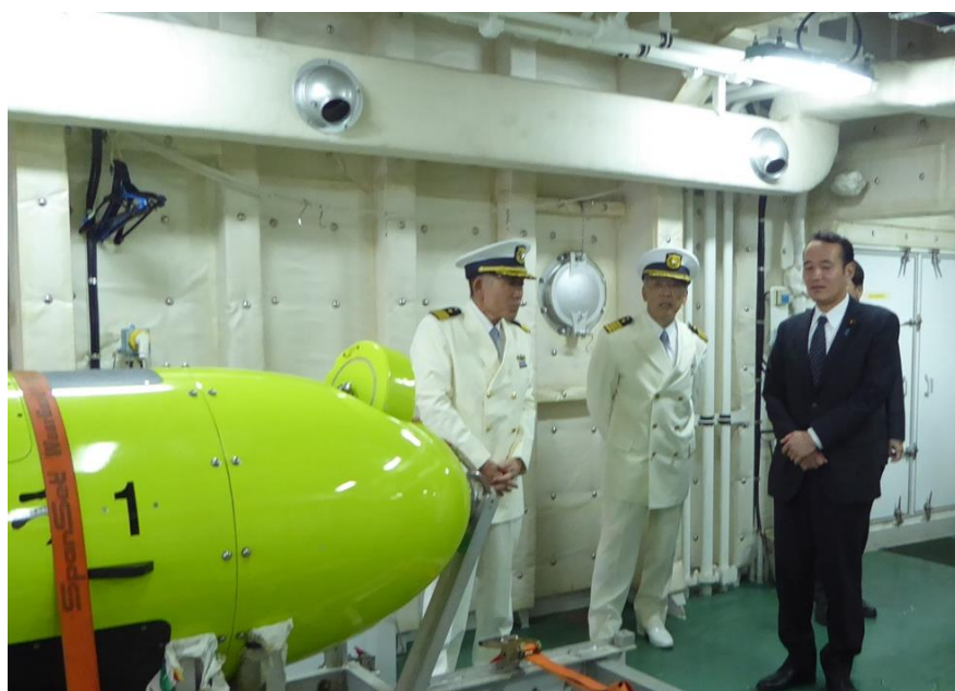
測量船拓洋にて観測機器の説明を受けられる築政務官