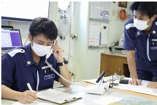
フィリピン沿岸警備隊と通信するこじま実習生