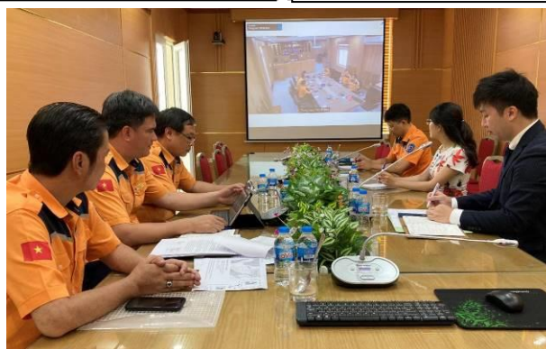
訓練中のベトナム海難救助センター本部 (通信中のダナン支部をオンラインで支援)