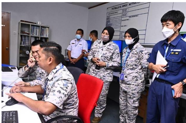
こじまと通信するマレーシア海上法令執行庁職員