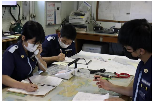
マレーシア側の情報を整理するこじま実習生