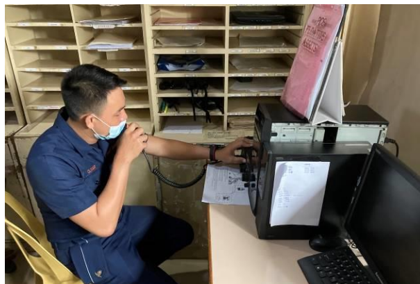
こじまと通信するフィリピンコーストガード職員