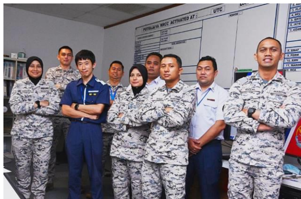
訓練に参加したマレーシア海上法令執行庁職員