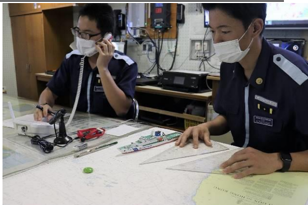
ベトナム側の情報を海図で確認するこじま実習生