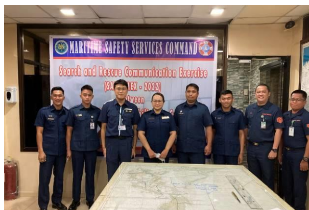
訓練に参加したフィリピン沿岸警備隊職員