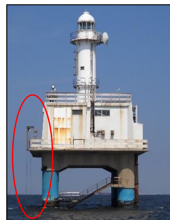
千葉灯標に設置したモニタリングポスト（図中赤線内）