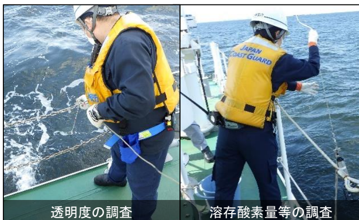
第三管区海上保安本部測量船「はましお」による調査

海上保安庁は毎年、モニタリングポストや第三管区海上保安本部所属の測量船による水質調査を行い、東京湾環境一斉調査に貢献しています。