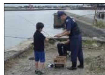
不法投棄防止の啓発