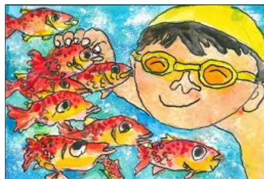
第21回 特別賞（国土交通大臣賞）受賞

受賞作品は、海上保安庁ホームページや広報を通じて公表します。表彰された絵は、美しくきれいな青い海を守り続けていくための活動の一助として広く活用させていただきます。