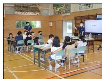
海洋環境保全講習会