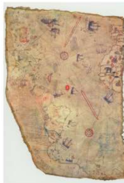
2013年受領 忠実に複製された図