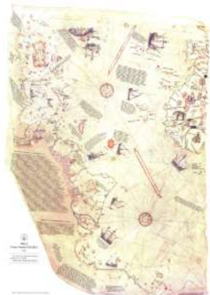
2006年受領 見易くデジタル処理された図