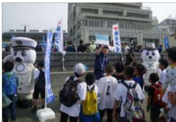
〇×クイズを通じた海洋環境保全教室 (6月2日 神奈川県茅ヶ崎市)