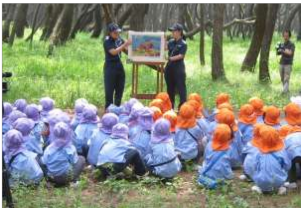
環境紙芝居を通じた海洋環境保全教室 (6月6日 佐賀県唐津市)