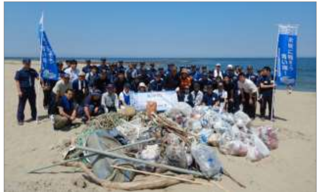
環境省事務所と連携した活動 (6月3日 新潟県新潟市)