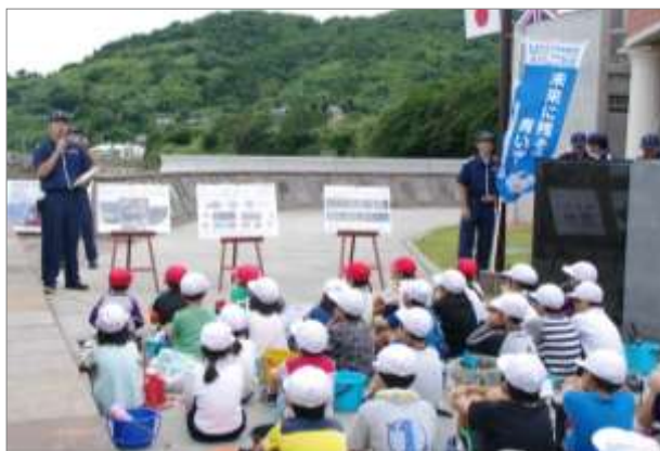
写真等を通じた海洋環境保全教室 (6月4日 鹿児島県串木野市)