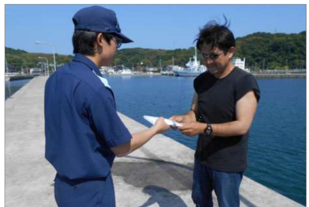
マリンレジャー愛好者等に対する不法投棄防止の呼びかけ