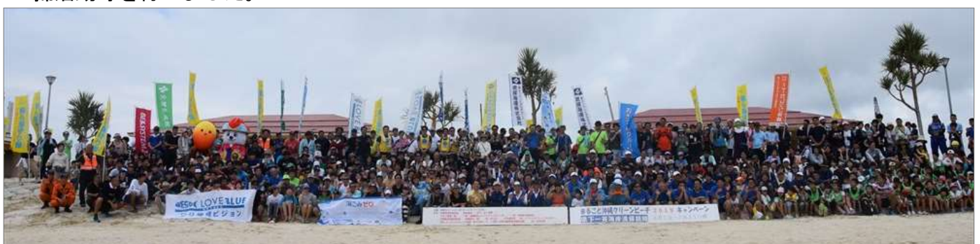
「まるごと沖縄クリーンビーチ2019」オープニングセレモニー(6月1日 沖縄県豊見城市)

自治体を含む行政機関、各種法人、ボランティア団体、マリンレジャー団体等と連携し、海浜清掃活動等を行いました。