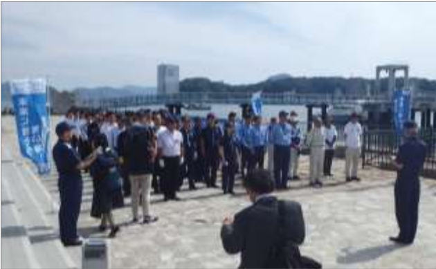
港湾関係機関と連携した活動 (5月30日 広島県広島市)

地方整備局港湾事務所、県土木建築局港湾振興課、県港湾振興事務所、港湾合同庁舎入居官署等の港湾関係機関、環境省地方環境事務所等の関係機関と連携し、海浜清掃活動を行いました。