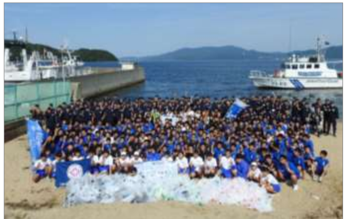
海洋高校、中学校及び小学校と連携した活動 (5月30日 京都府舞鶴市)