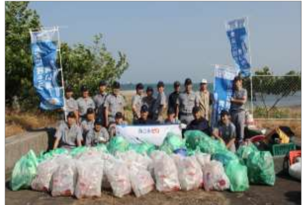
学校敷地周辺清掃 (6月5日 福岡県北九州市)