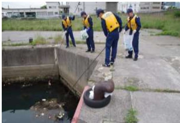
港内清掃 (5月31日 北海道函館市)