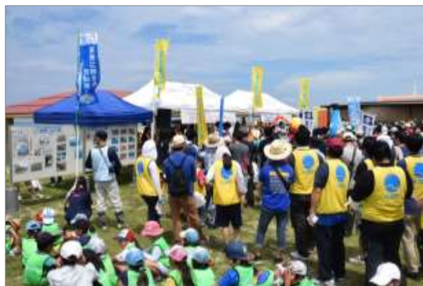
海浜清掃会場における環境パネル展 (6月1日 沖縄県豊見城市)