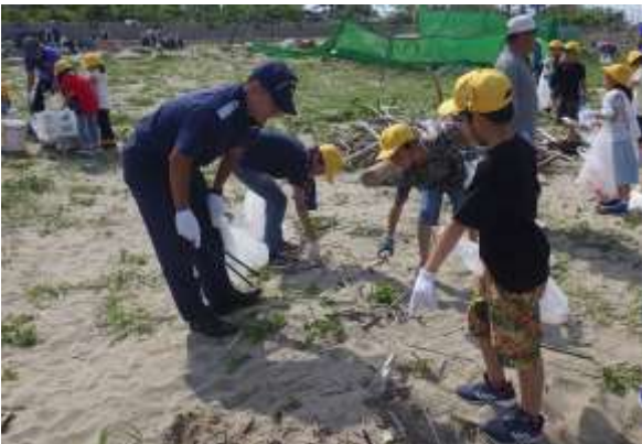
小学生児童との漂着ごみ分類調査 (6月1日 愛知県常滑市)

児童たちと海浜清掃を行い、回収したごみの分類調査を通して、漂着ごみの発生由来について学びました。