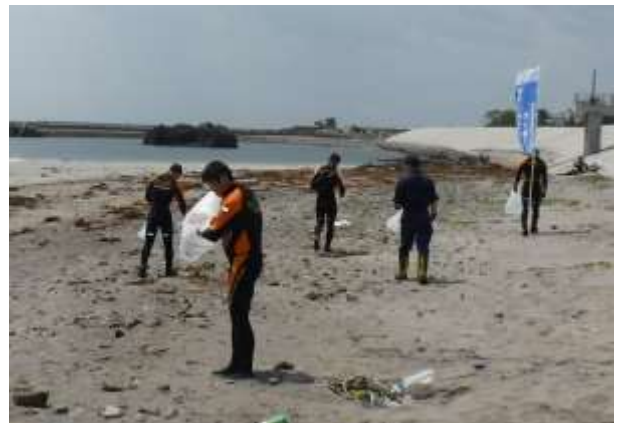
海岸清掃 (6月6日 宮城県宮城郡)