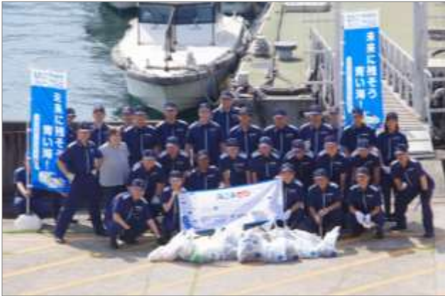
庁舎、船艇棧橋周辺清掃 (5月30日 広島県呉市)

海上保安庁単独でも海浜清掃活動を実施し、海事・漁業関係者、マリンレジャー愛好者等の海域利用者等の海洋環境保全の意識高揚に繋がりました。