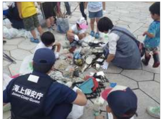
小学生児童との漂着ごみ分類調査 (6月8日 熊本県宇城市)