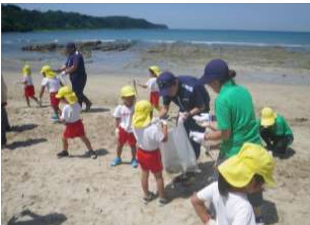
こども園園児及び保育士と連携した活動 (5月30日 和歌山県串本市)

幼児、児童、生徒及び教職員とともに海浜清掃を行い、プラスチックごみ等を回収しました。