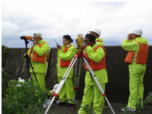
測量中の船舶の誘導実習（別府港）