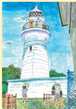
海岬灯台 (和歌山県)