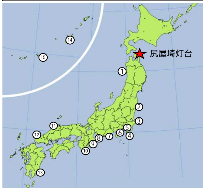
全国の参観灯台位置図