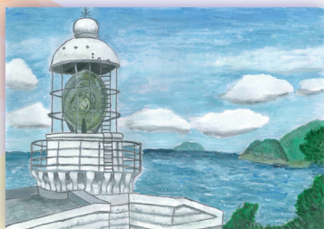
経ヶ岬灯台 (京都府)