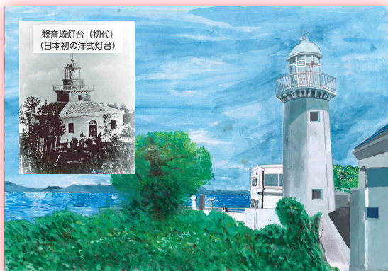
現在の観音埼灯台 (3代目、神奈川県)