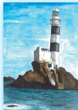
水ノ子島灯台 (大分県)