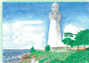
出雲日御碕灯台 (島根県)