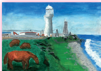
尻屋埼灯台 (青森県)