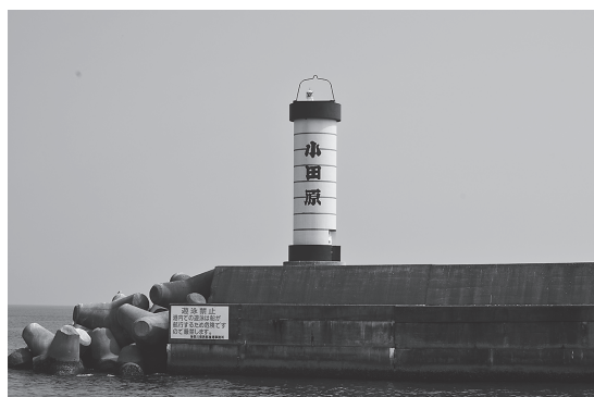
小田原港二号防波堤灯台（神奈川県）