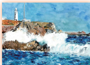
大吠埼灯台 (千葉県)