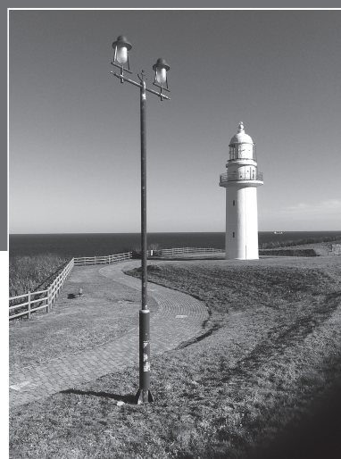
恵山岬灯台（北海道）