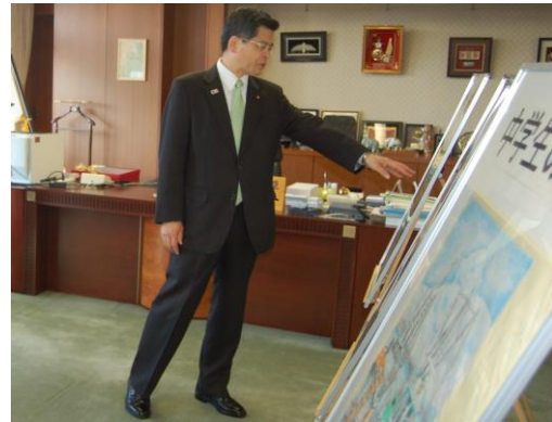
国土交通大臣による選考模様