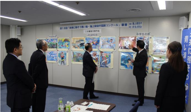
海上保安庁内の審査模様

10月10日（火）、長官、海上保安協会会長等による審査を実施しました。 また、10月26日（木）、国土交通大臣により特別賞（国土交通大臣賞）1点 を選考いただきました。