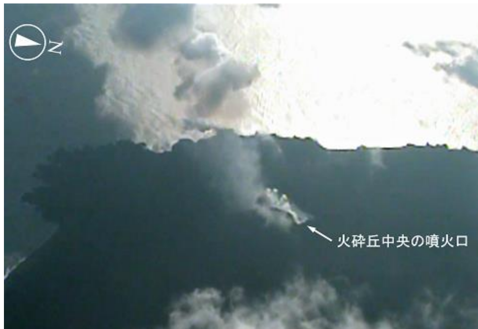
図1 火砕丘と噴煙（6月6日撮影）

火山活動が活発な状態が続いていますので、海上保安庁では引き続き航行警報により付近航行船舶に注意を呼びかけています。