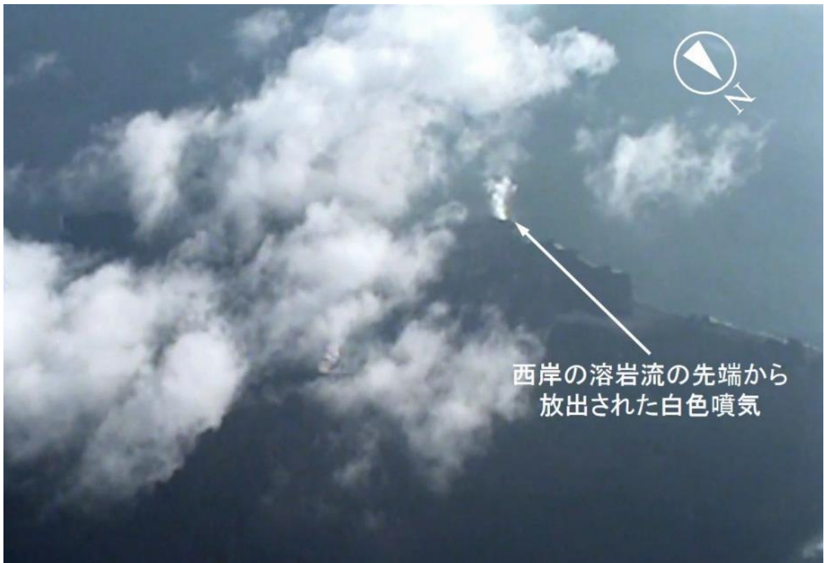
図2 西側の溶岩流先端からの白色噴気（6月6日撮影）