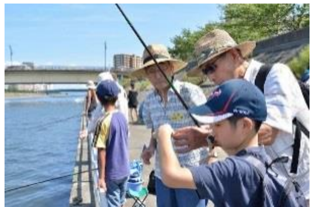
親子ハゼ釣り教室