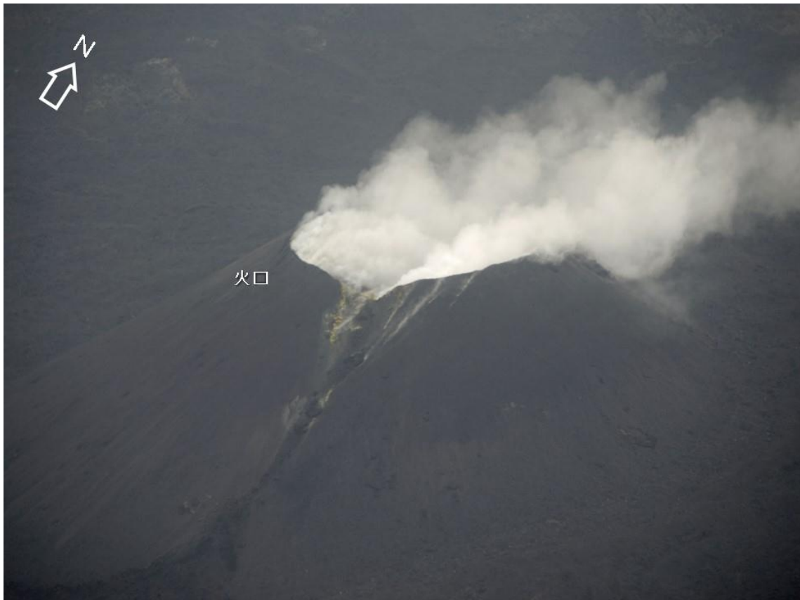
図1 火砕丘と火口の様子（4月14日撮影）