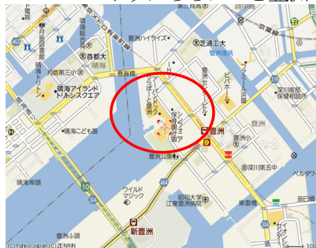
アーバンドックららぽーと豊洲