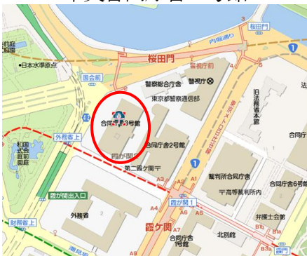
中央合同庁舎2号館