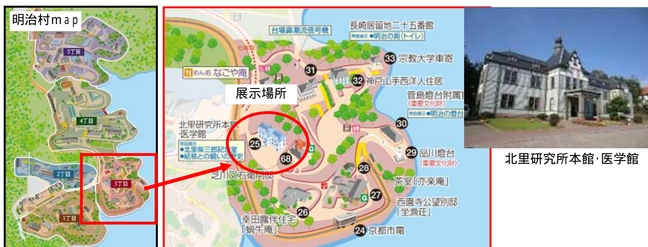
北里研究所本館・医学館