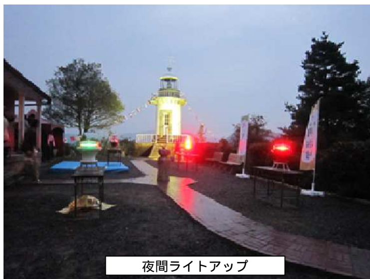
夜間ライトアップ