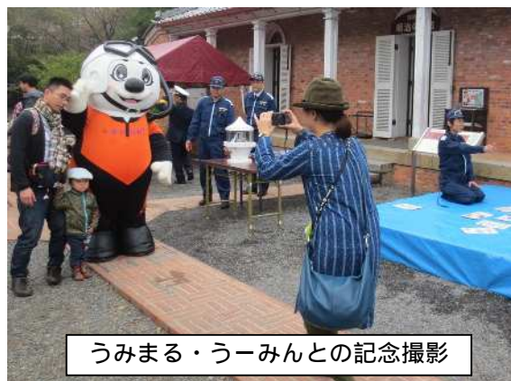
うみまる・うーみんとの記念撮影