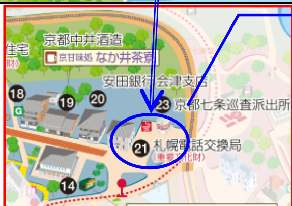
札幌電話交換局横