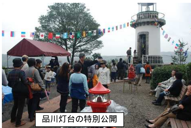
品川燈台の特別公開