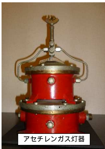
アセチレンガス灯器