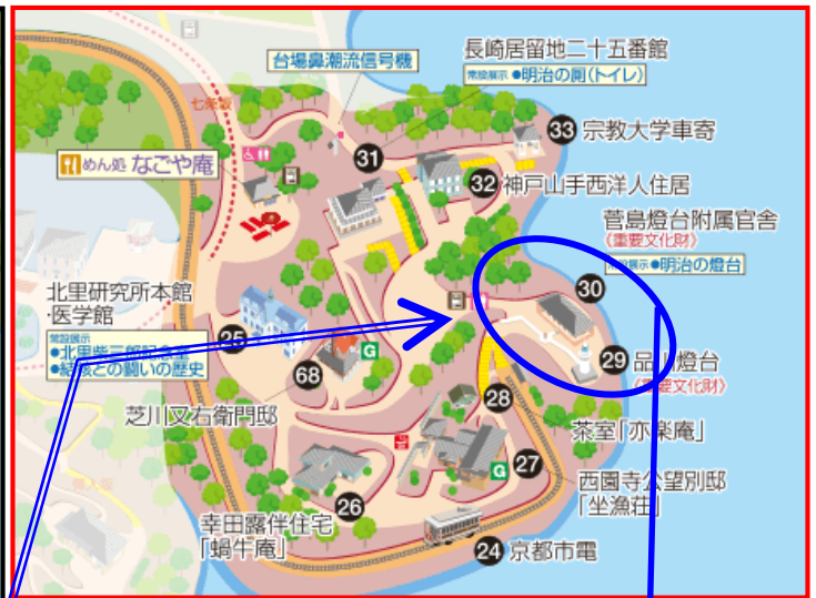
品川燈台前 (特別展示・イベント実施会場)