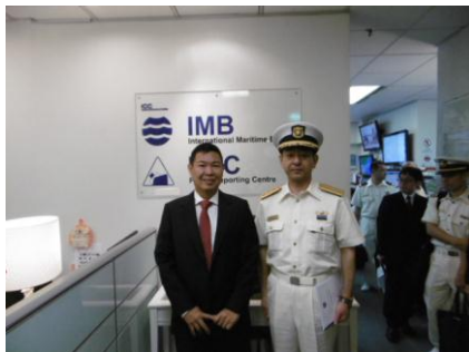
IMB 所長表敬・意見交換