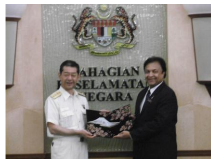
国家安全保障局長官 表敬・意見交換