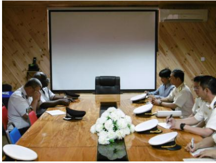
警察長官表敬・意見交換