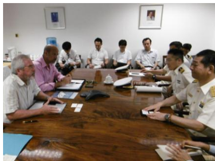
外務・運輸省（大使・大臣首席秘書官） 表敬・意見交換