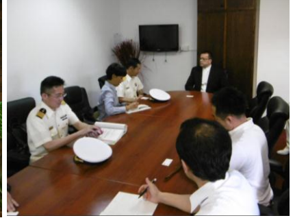
司法長官表敬・意見交換