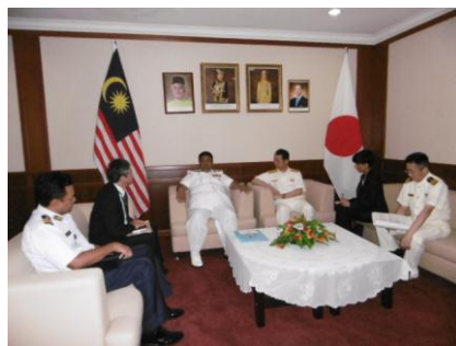
MMEA 副長官表敬・意見交換