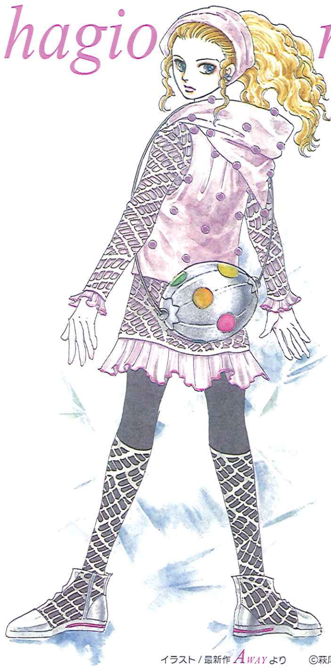
イラスト/最新作 AWAY より ©萩尾望都/小学館