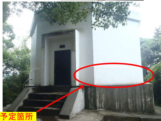
タイル展示予定箇所