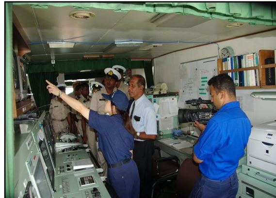
船内設備説明（機関室）