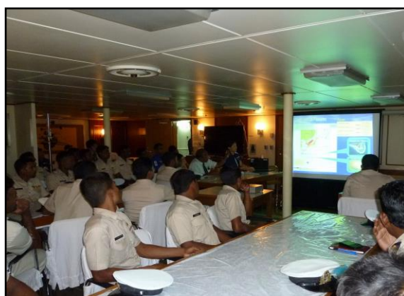
海上保安業務に関する研修