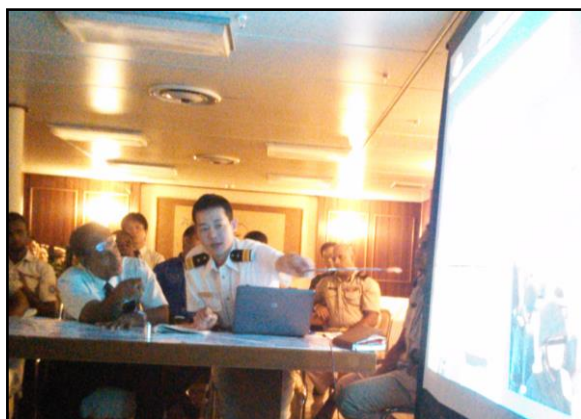
海賊対策に関する意見交換