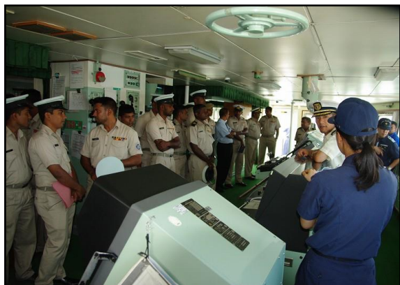
船内設備説明（船橋）