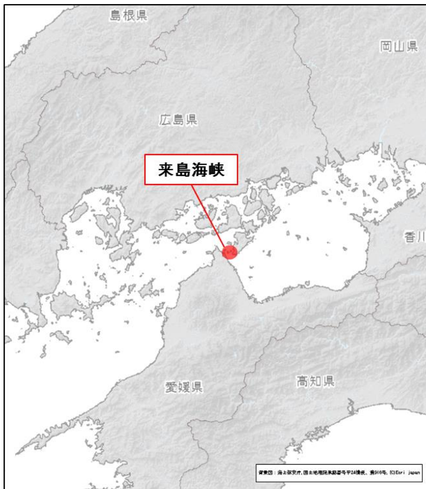
地図1 来島海峡の位置

http://www1.kaiho.mlit.go.jp/KANKYO/TIDE/kurushima_tidal_current/internet_currpred/Kurushima/htmls/select_areamap.html