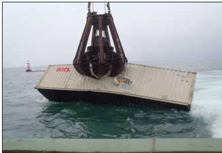
航路啓開(コンテナの引き上げ)