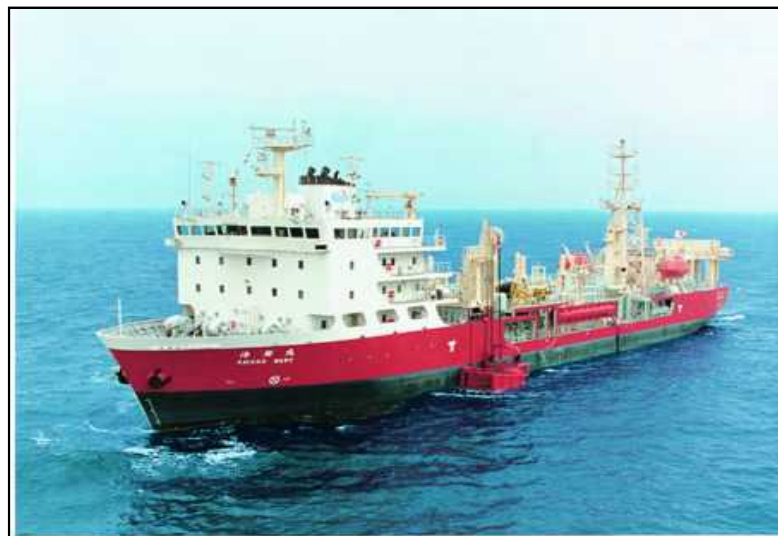
「海翔丸」による緊急支援物資の輸送